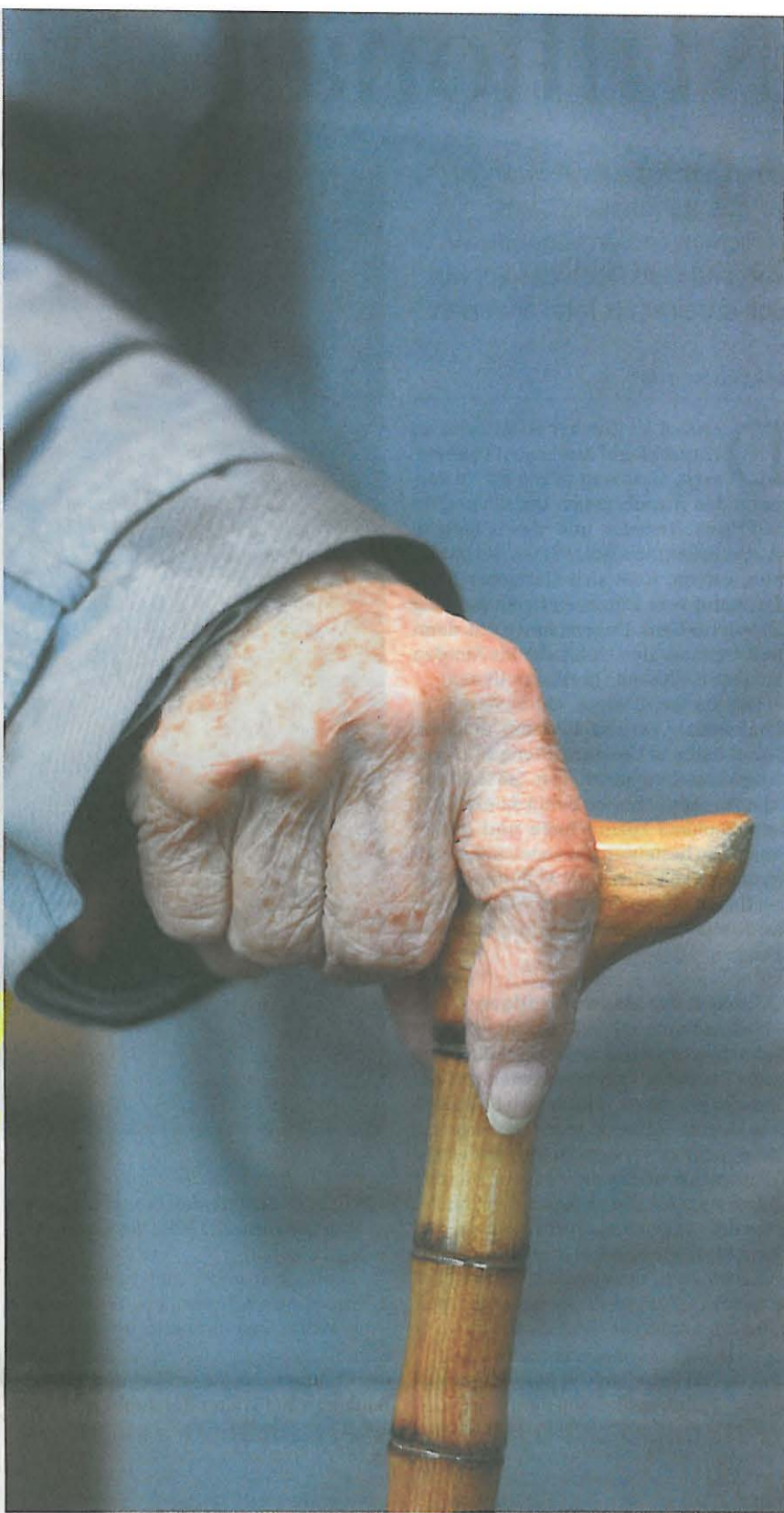
Seniorin: Hohe Rentenversprechen sind eine schwere Bürde für die Pensionskassen.

Lebensversicherer wie Swiss Life oder Baloise verzeichnen daher regen Zulauf. Bei Axa Winterthur wuchs das Neugeschäft im Vollversicherungsbereich in den ersten drei Quartalen 2011 um über einen Drittel auf 331 Millionen Franken. Die Zunahme hätte noch deutlich stärker ausfal-